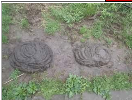
跑陽明山，還贈送兩片牛屎餅