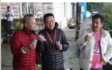
I Love Hash 的 Man Juice 來訪