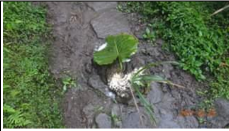
陽明山的牛屎,會長出荷花,好神奇