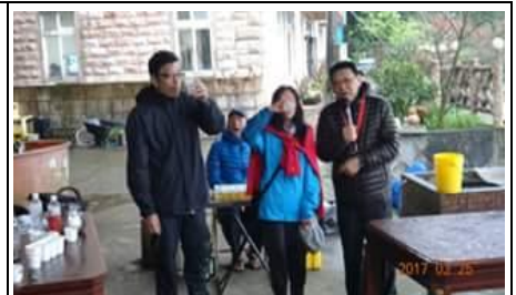
第一次來跑步,綠水介紹的