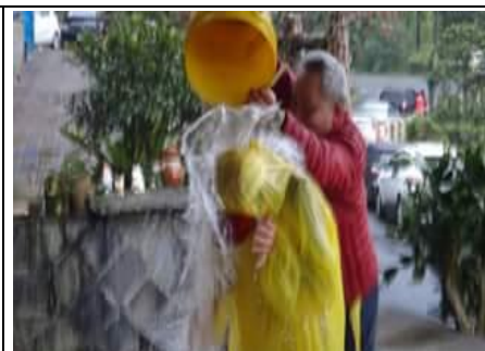
丫柳 跑 400 次穿雨衣被淋水