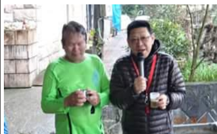
應賢哥! 跑兩年就有 100 次太神了!