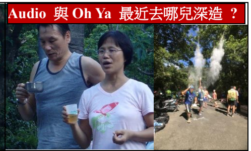
Audio 與 Oh Ya 最近去哪兒深造？